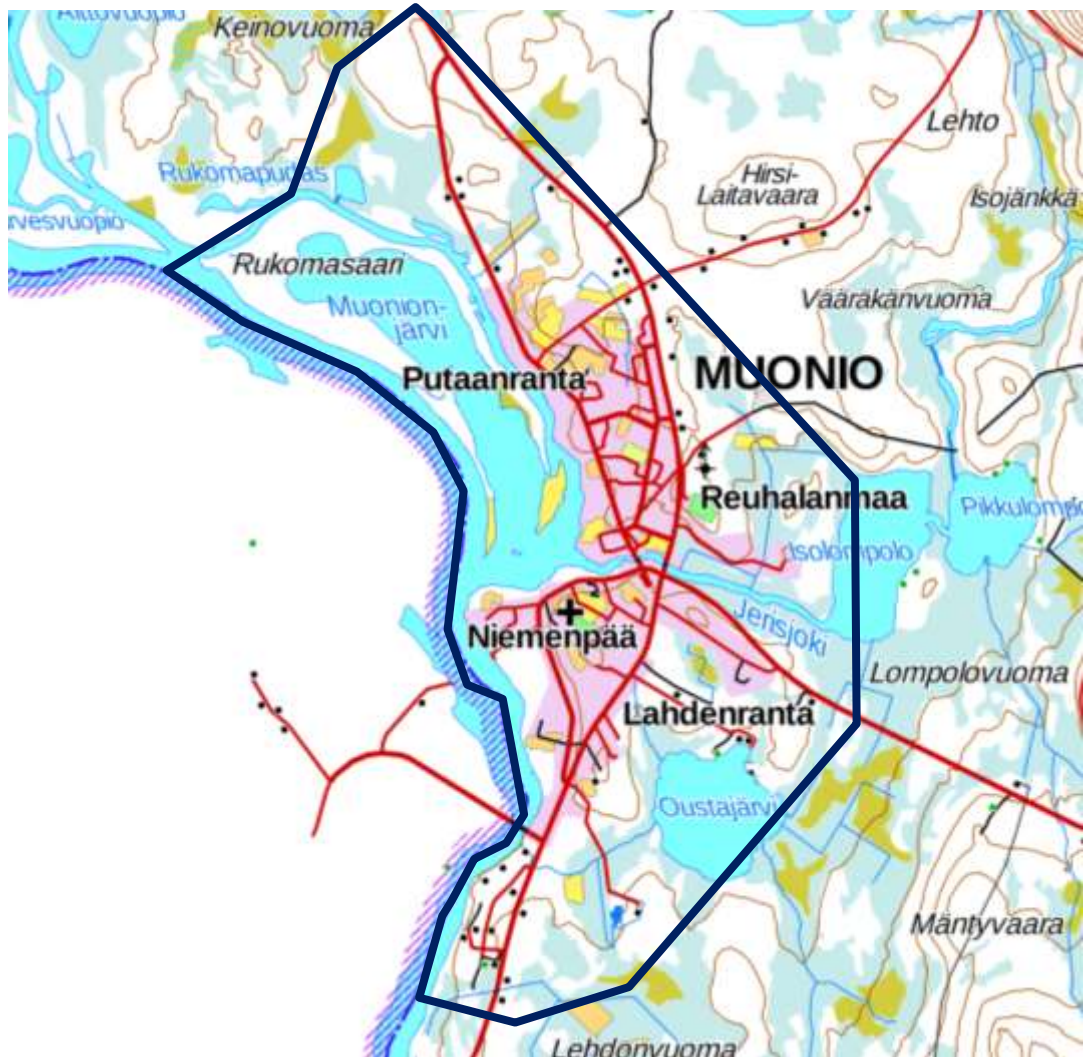
Kuva 1. Kaava-alueen likimääräinen rajaus (Paikkatietoikkuna/MML)